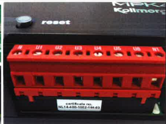
Impression neues Design mit Zertifikat-Nummer auf der SC-4 Schaltung gedruckt